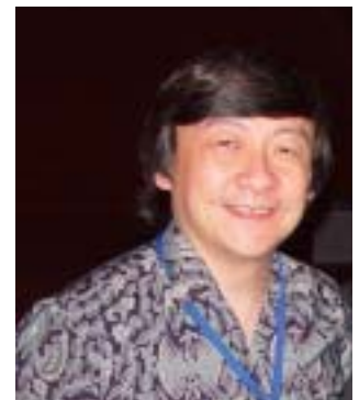
Pr. BEN WONG

De volta ao Brasil nos meses de Agosto e Setembro. Confira a agenda na p. 4